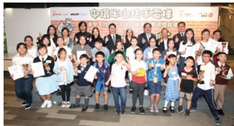
■ 比賽評審、嘉賓及得獎者拍大合照留念。

中環半山自動扶手電梯是區內重要的交通樞紐，旨在舒緩半山住宅區交通擠塞，惟自動扶梯長年不停運作，開始老化，故有迫切需要進行更新工程。工程於去年3月展開，預計於2022年完工。更新後的自動扶梯具備最先進的節能設施及照明系統，不但堅固耐用和環保，而且外觀更令人耳目一新。