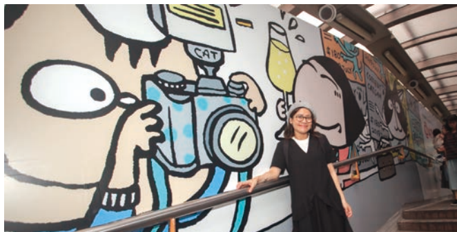
■ 文地貓為壁畫注入了不少活力元素，突顯這條自動扶梯與別不同之處。

自動扶梯連繫整個社區，繪畫比賽得獎者在作品表達了對自動扶梯的一份感情，並記錄居民多姿多彩的社區生活。獲邀設計壁畫的文地貓則把蘇豪區、地道老舖及歷史建築物一一放入畫作，帶出社區充滿活力的一面。