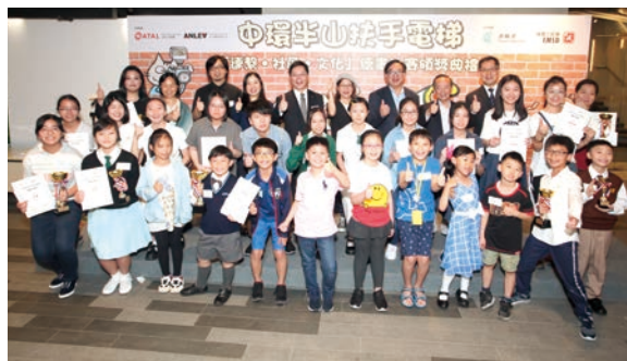
■ 比賽評審、嘉賓及得獎者拍大合照留念。