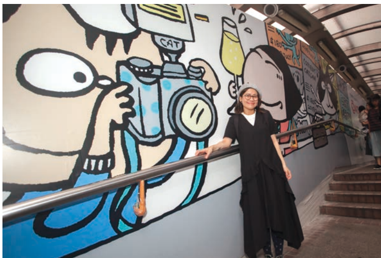
■ 文地貓為壁畫注入了不少活力元素，突顯這條自動扶梯與別不同之處。

中環半山自動扶手電梯是區內重要的交通樞紐，旨在紓緩半山住宅區交通擠塞，惟自動扶梯長年不停運作，開始老化，故有迫切需要進行更新工程。工程於去年3月展開，預計於2022年完工。更新後的自動扶梯具備最先進的節能設施及照明系統，不但堅固耐用和環保，而且外觀更令人耳目一新。